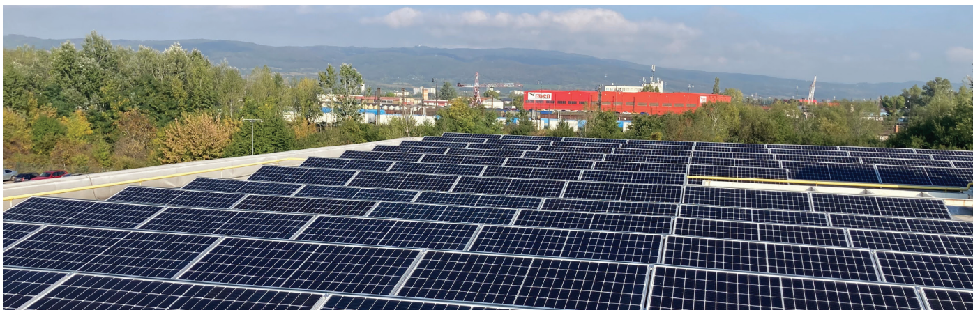
Inštalácia Motor Car - Mercedes Bratislava 98 kW